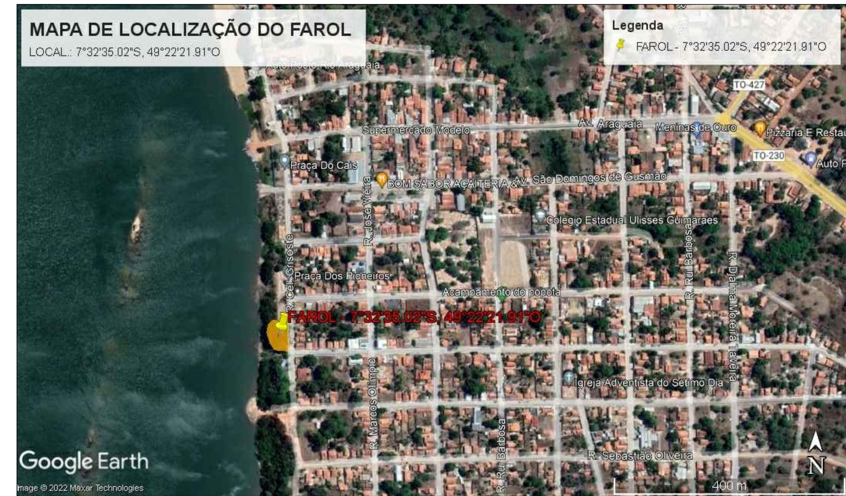
PLANTA DE SITUAÇÃO